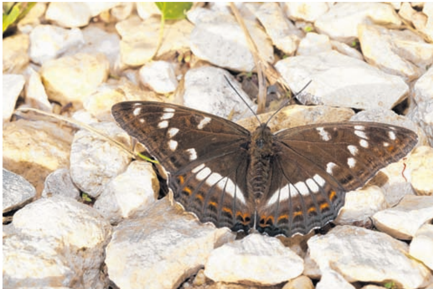
Grosser Eisvogel (Limenitis populi). Die Schmetterlingsart galt in der Region bis vor Kurzem als praktisch ausgestorben.

Pfeffingen. Europas grösster Tagfalter kommt im Baselbiet noch immer vor und pflanzt sich fort