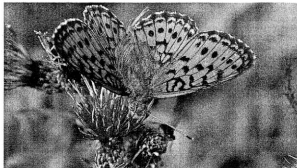
Violetter Silberfalter. Für den seltenen Schmetterling ist es «fünf vor zwölf» im Baselbiet.

Die Hälfte aller Baselbieter Tagfalterarten ist gefährdet – ein Projekt gibt Gegensteuer