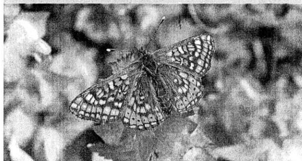
Skabiosenscheckenfalter. Nur noch vereinzelt auf Baselbieter Magerwiesen ist das 30 bis 40 Millimeter grosse Tier anzutreffen.